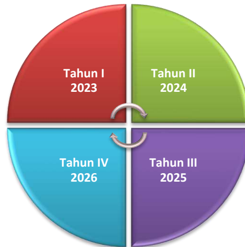
Gambar 2.2 Posisi Dokumen RKPD Tahun 2025 Terhadap RPD 2023-2026

Sumber: RPD Provinsi Kepulauan Bangka Belitung Tahun 2023-2026,