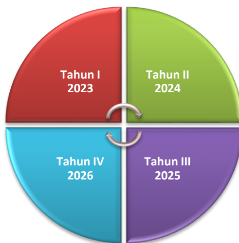
Gambar 2.1 Posisi Dokumen RKPD Tahun 2023 Terhadap RPD 2023-2026

Sumber: RPD Provinsi Kepulauan Bangka Belitung, 2022 (diolah)