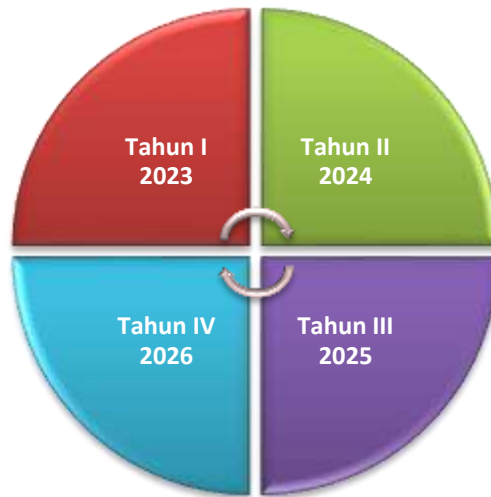
Gambar 2.2 Posisi Dokumen RKPD Tahun 2025 Terhadap RPD 2023-2026

Sumber: RPD Provinsi Kepulauan Bangka Belitung Tahun 2023-2026,