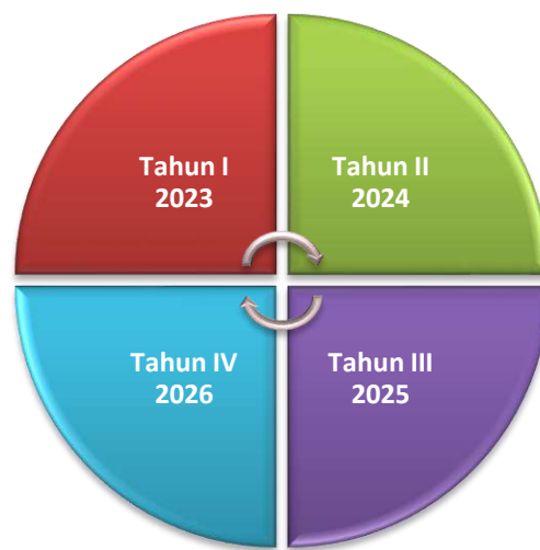
Gambar 2.2 Posisi Dokumen RKPD Tahun 2024 Terhadap RPD 2023-2026

Sumber: RPD Provinsi Kepulauan Bangka Belitung, 2022 (diolah)