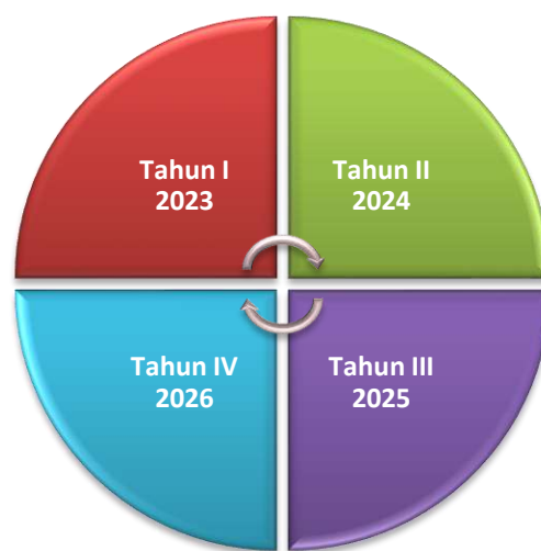
Gambar 2.2 Posisi Dokumen RKPD Tahun 2024 Terhadap RPD 2023-2026

Sumber: RPD Provinsi Kepulauan Bangka Belitung Tahun 2023-2026, 2022 (diolah)